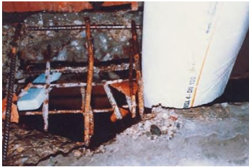
KMI_schallgedaemmte_Rohre_4.jpg Vor Beschädigungen durch scharfe Kanten, z.B. bei Durchbrüchen, vorstehenden Armierungen oder einen herumliegenden Nagel schützen nur hochwertige Dämmungen.