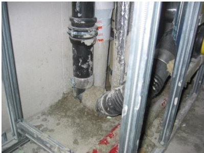
KMI_schallgedaemmte_Rohre_6.jpg Unachtsamkeit beim Vergiessen des Deckendurchbruches kann das Abwasserrohr mit dem Baukörper verbinden und somit eine lästige und deutlich hörbare Körperschallbrücke herstellen.