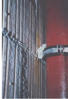
KMI_schallgedaemmte_Rohre_3.jpg Kleine Ursache, große Wirkung: Schon ein einziger Körperschallkontakt zum Baukörper in der Größe eines Centstücks oder kleiner kann den Schallpegel um bis zu 15 db (A) erhöhen.