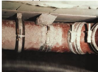
KMI_schallgedaemmte_Rohre_5.jpg Herabfallender Mörtel kann das Abwasserrohr mit dem Baukörper verbinden und somit eine lästige und deutlich hörbare Körperschallbrücke herstellen.